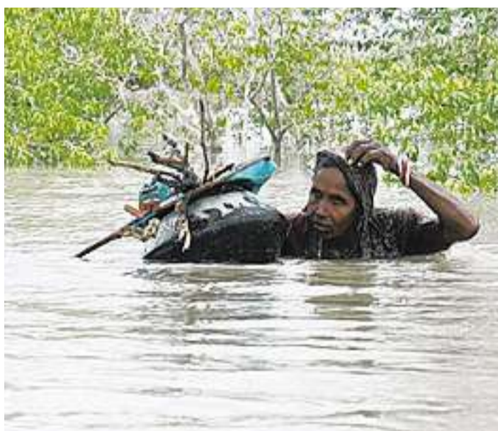
Die Kultur beeinflusst auch den Umgang mit Risiko.

pd | Beim Umgang mit Risiken und Katastrophen kann der ethische Hintergrund eine grosse Rolle spielen. Warum dies so ist, wie sich dies auswirkt und wie man dieses Wissen bei Risikoprävention und im Ernstfall einsetzen kann, dazu findet am Mittwoch, 2. Juni, um 20.15 Uhr anlässlich der 3. Internationalen Disaster and Risk Conference IDRC Davos 2010 eine öffentliche Diskussionsrunde im Kongresszentrum statt. Risiken können verschieden beurteilt werden. Einerseits von einem rein technischen Hintergrund. Hier wird die Frage gestellt, mit welchen Massnahmen welche Risiken und welche Schäden verhindert werden können und welche Kosten dabei entstehen oder vermieden werden können.